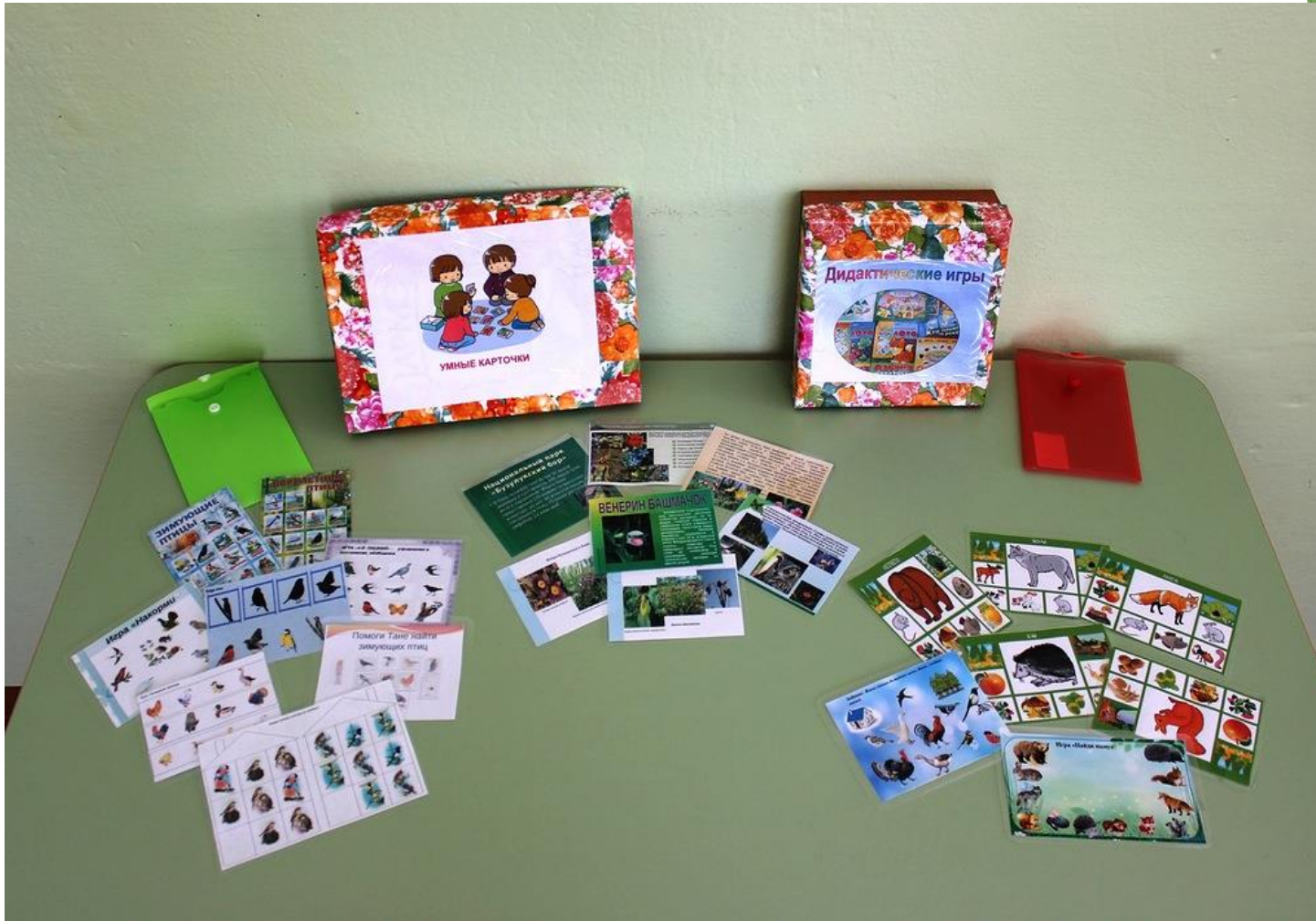
Дидактические игры «Чей хвост?» «Чей дом», «Назови животного Бузулукского бора», «Кто что ест?», «Назови семью»