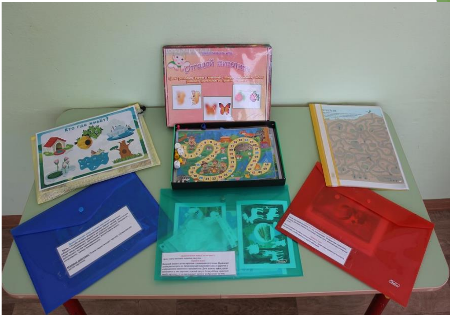
Игры- ходилки, «умные карточки», дидактическая игра «От какого животного тень?»