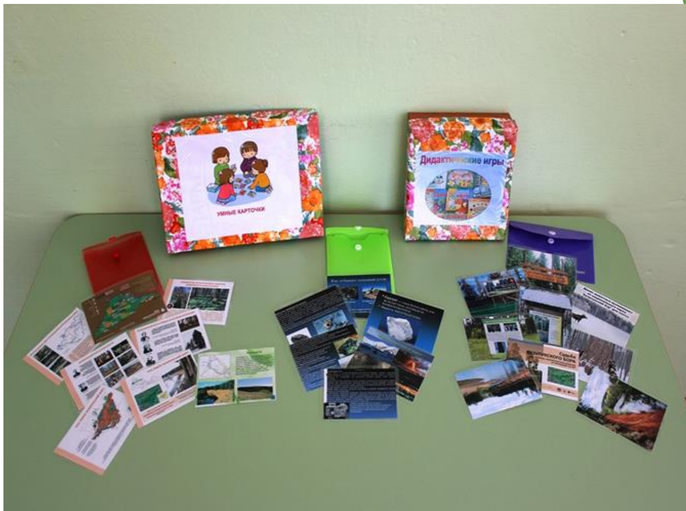
Набор карточек «Полезные ископаемые Бузулукского бора», «Природные памятники Национального парка «Бузулукский бор»