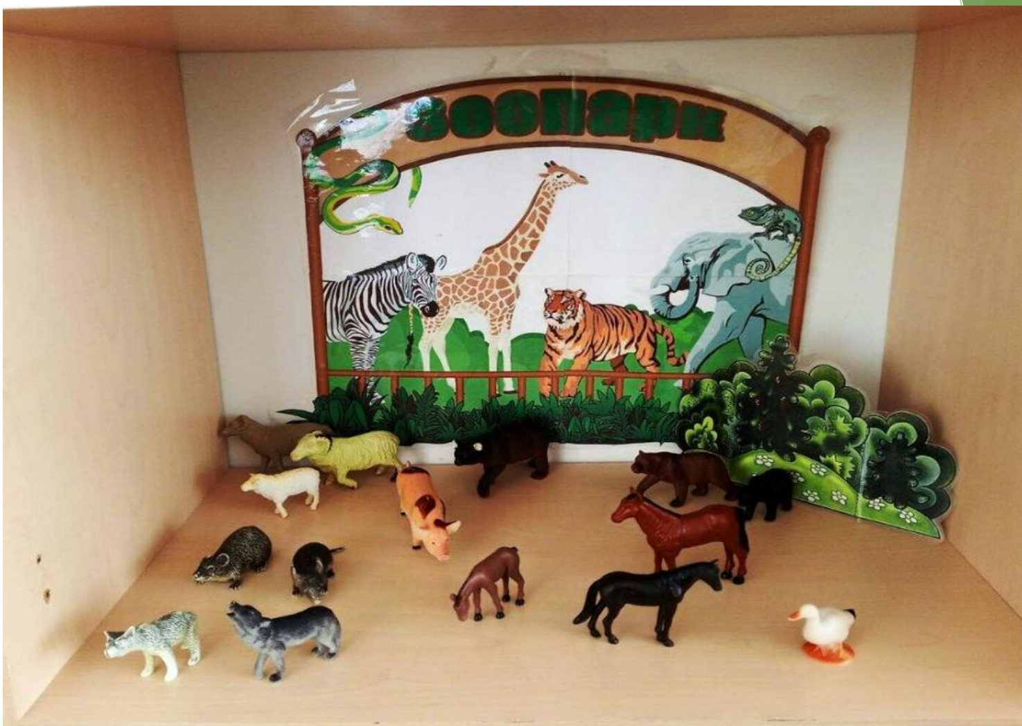
Игры с фигурками животных